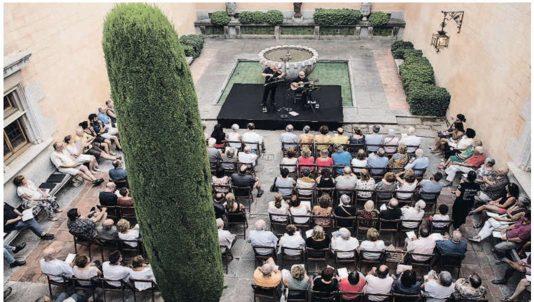
El Festival de Torroella de Montgrí encara la darrera setmana de concerts.

UNA VILA MUSICAL. El Festival de Torroella posa punt final a la programació d'enguany amb diversos concerts de clàssica. Avui és el torn dels premiats Cosmos Quartet, que presenten un programa de cambra que inclou un quartet inacabat de Schubert, a l'Auditori