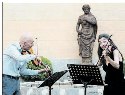
PERE DURAN / NORD MEDIA