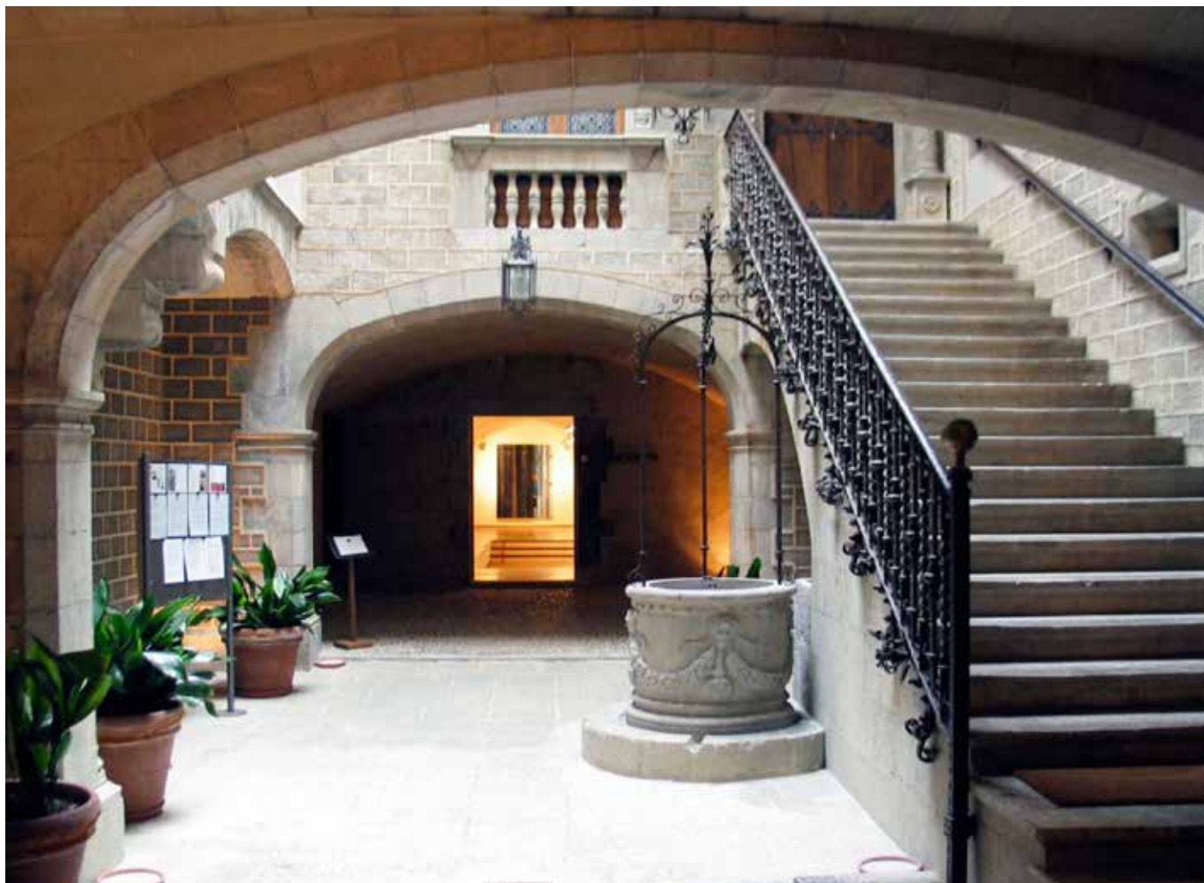
Palau Solterra, seu del Museu de Fotografia Contemporània de la Fundació Vila Casas. Torroella de Montgrí

El Palau Solterra és el Museu de Fotografia Contemporània (Nacional i Internacional) de la Fundació Vila Casas situat a la localitat empordanesa de Torroella de Montgrí. Es va inaugurar l'any 2000 i a actualment acull al voltant de 200 fotografies contemporànies exposades d'artistes de diverses parts del món.