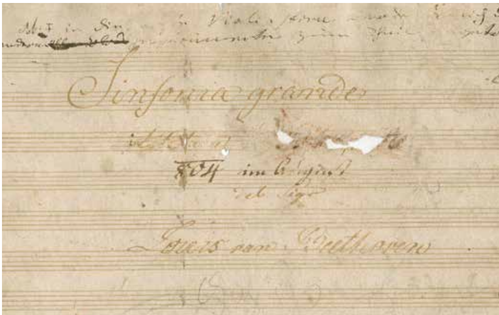
Portada de la Simfonia núm. 3 de Beethoven.

Beethoven, que està treballant des de 1803 en la seva Tercera Simfonia , està decidit a dedicar-la a honor i glòria d'aquest jove militar nascut a Còrsega, que de petit odiava el poder francès que oprimia la seva illa natal.