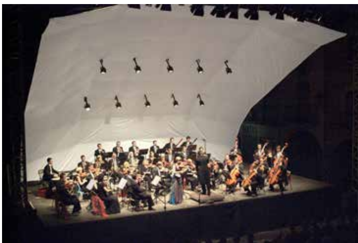
Prague Philharmonia; Jacob Hrusa, director. L. van Beethoven Simfonia núm. 3, Op. 55 'Heroica'.

Els intèrprets han estat els pianistes Joaquín Achúcarro, Piotr Anderszewski, Ronald Brautigam, Rudolf Buchbinder, Lukas Geniusas, Elisabeth Leonskaja, Paul Lewis, Alice Sara Ott, Grigory Sokolov; els violinistes Isabelle Faust, Rodney Friend, Leticia Moreno, Pinchas Zukerman; el violoncellista Radu Aldulescu; la soprano María Bayo; el Trio de Barcelona, Pasquier Trio, Guarneri Trio; l'Arditti Quartet, Petersen Quartet, Zemlinsky Quartet; la Prague Chamber Orchestra, Czech Philharmonic Chamber Orchestra, Orquestra Simfònica del Vallès, Prague Philharmonia, Prague Symphony Orchestra i el cor Prague Philharmonic Choir, entre altres.