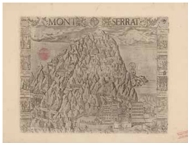
Mont Serrat 1601 © Institut Cartogràfic i Geològic de Catalunya

A Montserrat, els francesos hi arriben per primera vegada el gener de 1809. No és, però, fins a l'any següent que l'exèrcit napoleònic saqueja el monestir i provoca un gran incendi que juntament amb la segona gran crema que té lloc el 1812 destrueix bona part de l'arxiu de Montserrat i del patrimoni que s'hi conservava.