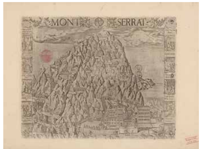
Mont Serrat 1601

Los franceses llegaron por primera vez a Montserrat en enero de 1809. Sin embargo, no es hasta el año siguiente que el ejército napoleónico saquea el monasterio y provoca un gran incendio, que junto con el segundo gran fuego que tiene lugar en 1812 destruye buena parte del archivo de Montserrat y del patrimonio que se conservaba.