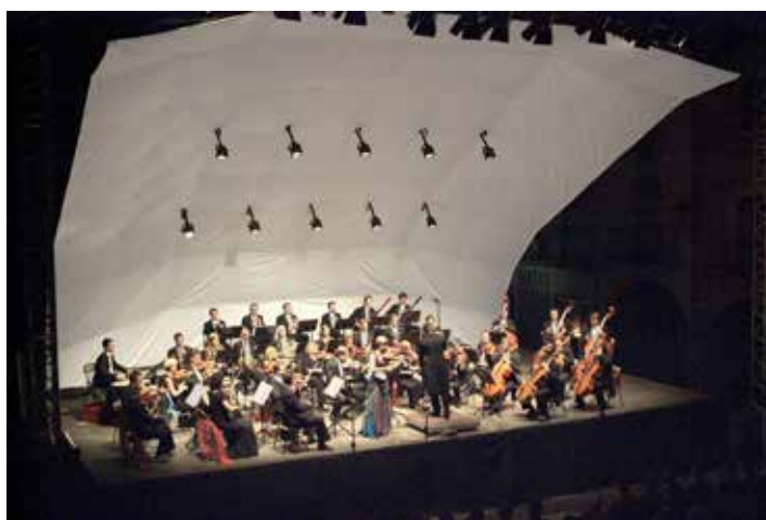
Prague Philharmonia; Jacob Hrusa, director. L. van Beethoven Sinfonía n.º 3, Op. 55 'Heroica'. Festival de Torroella, 2005.