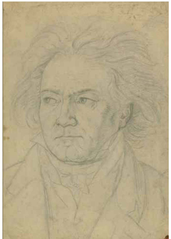
August von Kloeber, Beethoven, 1818. Dibujo de lápiz sobre papel

Cuando en 1827 Ludwig van Beethoven muere, el mundo es ya muy diferente de aquel que lo vio nacer. El alcance de su contribución en este desarrollo vital, que borra todo tipo de fronteras, no ha dejado de crecer desde aquel día.