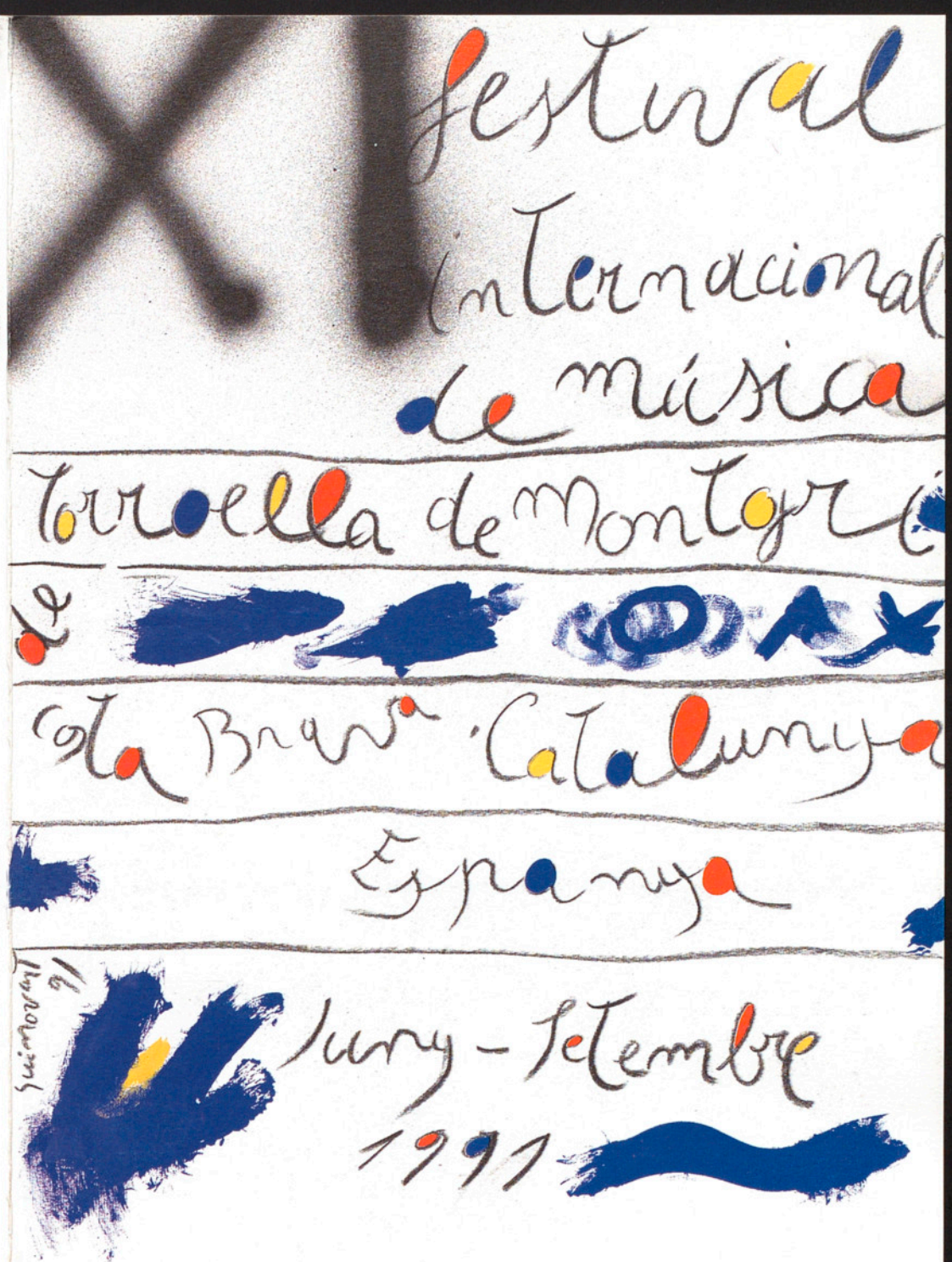
Obra original de Josep Guinovart